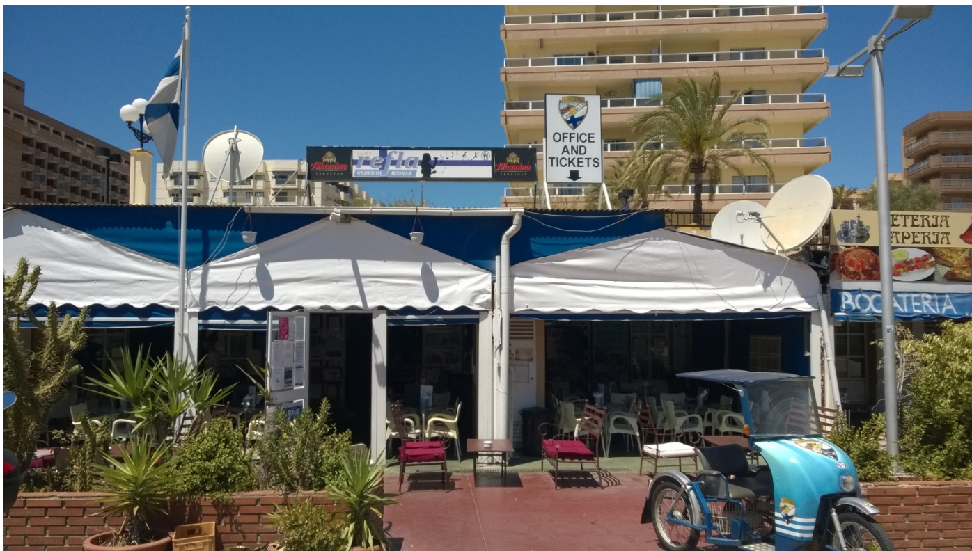
kuva Uusi-Reflan edestä